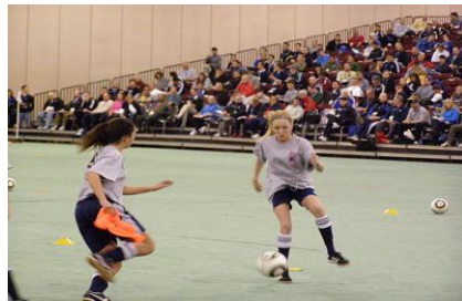
Annar af verklegu sýningarsölunum