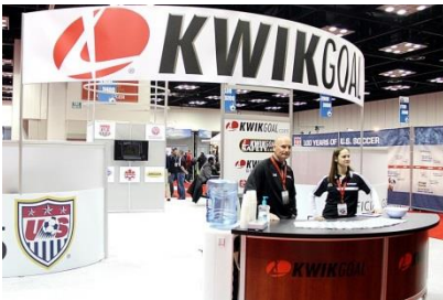
Kwik Goal er mjög áberandi á ráðstefnunni

sýningarsalur þar sem tæplega þrjúhundruð fyrirtæki og einstaklingar kynna vörur tengdar knattspyrnu, allt frá takkaskóm yfir í bækur, geisladiska, forrit og nýjar uppfynningar. Hægt er að gera góð kaup á sýningunni og keyptum við okkur m.a bækur og dvd diska með fræðslufni. Mikið af mis gáfulegu fólki reynir að koma „uppfynningum“ sínum á framfæri á þessari sýningu og töluvert af fólki sem hefur litið sem ekkert vit á knattspyrnu. Þar sáum við m.a köngulóar-markmannshanska, hanska með sundfitum á milli fingra til að stækka varnarsvæði hanskans. Þar sáum við einnig ennisband með plasthlíf til að verjast höfuðhöggum þegar þú skallar boltann, takkaskó með Ál-rist svo þú getir skotið fastar og svo má halda áfram. Flestir eru þarna í góðri trú og er töluvert af stórum fyrirtækjum s.s Nike, Puma, kwik Goal og Under armor sem gefa góð tilboð af góðum vörum.